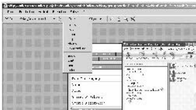
Abbildung 2: Arbeitsprozessintegrierte, gruppenspezifische Kommunikation und Kooperation

Interaktion in Gruppen: Die WiKo-Anwendung unterstützt die selbst organisierte Bildung und Verwaltung von Gruppen unterschiedlichen Typs – wie Teams, Communities und Netze. Sie bietet eine sehr schnell und einfach zu nutzende gruppenspezifische Kommunikation und Kooperation. Neben Werkzeugen zur synchronen (wie Audio, Messenger) und asynchronen Kommunikation (wie Mail, Forum) können auch Systeme zur kooperativen Entwicklung des explizierten Wissens in der Gruppe genutzt werden. Existierende, etablierte Werkzeuge, z. B. MSN Messenger, wurden in die WiKo-Anwendung integriert. Die Gruppenwahrnehmungsfunktion informiert die Mitglieder über Aktivitäten der Gruppe.