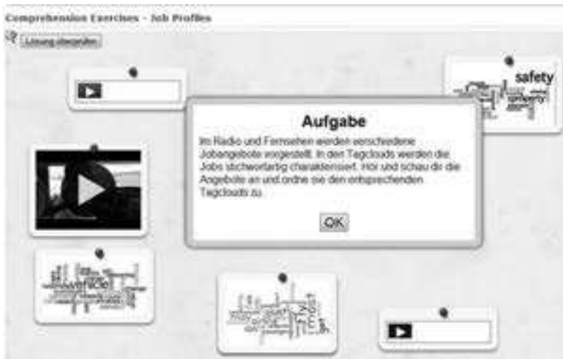
Abbildung 1: Multimediale Zuordnungsübung aus dem Fremdsprachenunterricht

Das Autorenwerkzeug stellt eine intuitive Benutzerschnittstelle zur Verfügung, über welche die Autorinnen und Autoren verschiedene Medien einbinden und auch einfache Bearbeitungen vornehmen können (siehe Abbildung 2). Auf Grund der einfachen Bedienung können auch Schülerinnen und Schüler selbst Autoren und Autorinnen von Lernbausteinen sein. Damit lässt sich das Werkzeug für konstruktivistische Unterrichtsszenarien wie Lernen durch Lehren einsetzen. Rund 20% aller Lernbausteine, die auf der Plattform angeboten werden, wurden von Lernenden erstellt. Speziell nützlich ist bei der Nutzung durch Schülerinnen und Schüler, dass bestehende Lernbausteine als Vorlage genommen und die eingebundenen Medien sehr einfach ausgewechselt werden können. So können beispielsweise die Lernenden als Aufgabe basierend auf dem vorangehend skizzierten Comprehension Exercise selbst weitere Übungen erstellen.