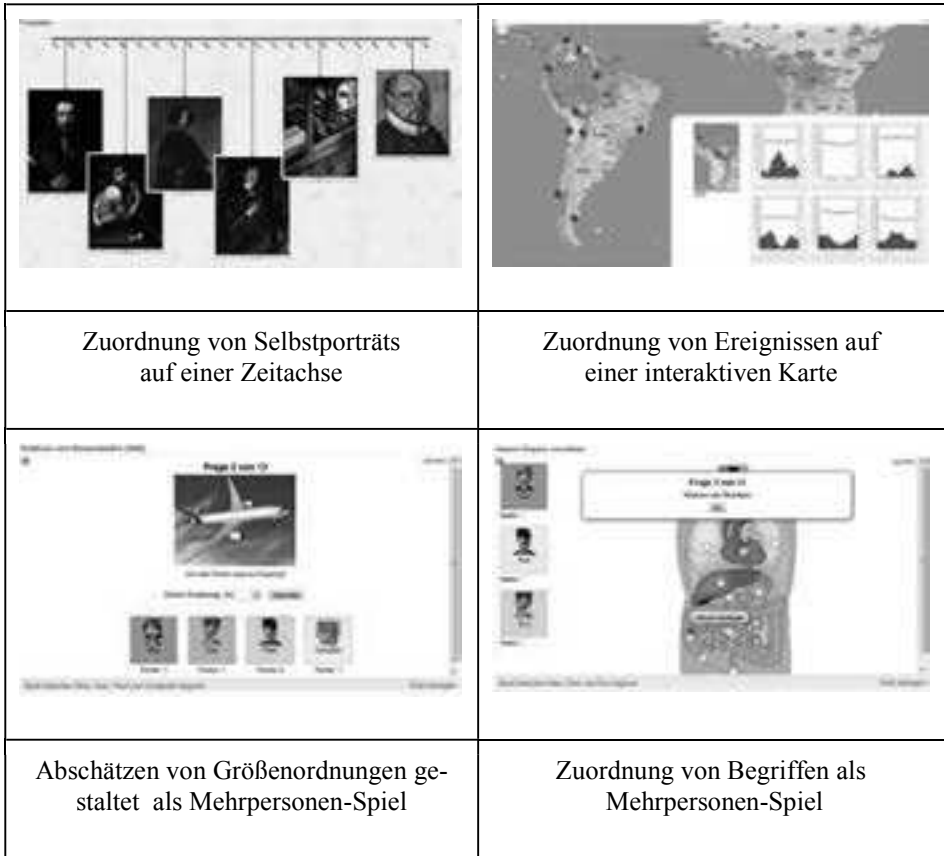
Abbildung 4: Auswahl von Vorlagen zur Gestaltung von Lernbausteinen

Mit LearningApps wurden einige bereits früher im Rahmen des Forschungsprojektes Questix/Matchix [SOH09] an der ETH Zürich angedachte Ideen konsequent weiter entwickelt und mit modernen Technologien umgesetzt. Voraussetzung für die Nutzung im Unterricht ist eine entsprechende Infrastruktur an den Schulen, insbesondere eine gute Internetanbindung und idealerweise der Einsatz mobiler Endgeräte.