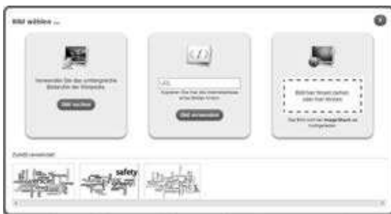
Abbildung 2: Einfaches Anpassen von Medien in bestehenden Lernbausteinen

Das Autorenwerkzeug stellt eine intuitive Benutzerschnittstelle zur Verfügung, über welche die Autorinnen und Autoren verschiedene Medien einbinden und auch einfache Bearbeitungen vornehmen können (siehe Abbildung 2). Auf Grund der einfachen Bedienung können auch Schülerinnen und Schüler selbst Autoren und Autorinnen von Lernbausteinen sein. Damit lässt sich das Werkzeug für konstruktivistische Unterrichtsszenarien wie Lernen durch Lehren einsetzen. Rund 20% aller Lernbausteine, die auf der Plattform angeboten werden, wurden von Lernenden erstellt. Speziell nützlich ist bei der Nutzung durch Schülerinnen und Schüler, dass bestehende Lernbausteine als Vorlage genommen und die eingebundenen Medien sehr einfach ausgewechselt werden können. So können beispielsweise die Lernenden als Aufgabe basierend auf dem vorangehend skizzierten Comprehension Exercise selbst weitere Übungen erstellen.