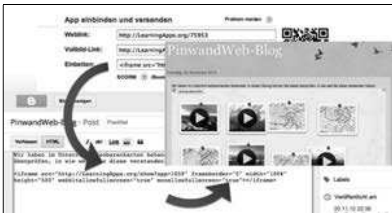
Abbildung 3: Verwenden von Lernbausteinen in Kursmaterialien

Erstellte Lernbausteine lassen sich auch in für Web 2.0-Dienste üblicher Art in unterrichtsbegleitende Websites, Lernplattformen, Blogs oder Wikis einbetten. Abbildung 3 zeigt die Einbettung einer Zuordnungsübung von Wettervideos zu Isobarenkarten in den Blog einer Lehrveranstaltung. Lernbausteine können auch in virtuellen Klassenräumen strukturiert und verwaltet werden.