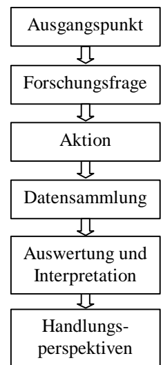
Abb. 2: Phasen der Studie

Rollierende Planung war manchmal notwendig: Der Wechsel von Regionalgruppen zu Themengruppen am 2. Seminar war wohl methodisch ausgeklügelt, aber bloß an thematischer Nähe der gewählten Themen ausgerichtet,