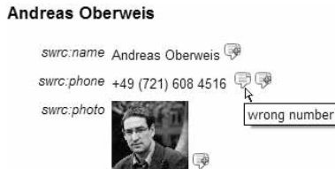
Abbildung 3: Annotation eines speziellen Tripels in der Individualansicht

Kommentare und Annotationen: Alle durch OntoWiki präsentierten RDF-Tripel können annotiert, kommentiert und bewertet werden. Dies ermöglicht community-gesteuerte Diskussionen, beispielsweise zur Validität bestimmter Aussagen. Die technische Basis dafür bildet das RDF-Konzept der Reifikation, welches Aussagen über Aussagen erlaubt. Ein kleines Icon an einem Objekt einer Aussage signalisiert, dass eine solche Reifikation existiert (siehe Abbildung 3). Beim Überfahren des Icons mit der Maus erscheint ein Tool-Tip, der die letzte Annotation anzeigt. Ein Klick auf das Icon zeigt alle verfügbaren Annotationen.