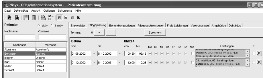
Abb.2: Patientenverwaltung – Pflegeplanung

Für jeden Patienten kann ein individueller Pflegeplan erstellt werden. (Abb.2) Dabei werden der Zeitraum, die Uhrzeiten und die Wochentage für die Erbringung bestimmter Leistungen erfasst. Diese Daten dienen dem Desktop-System als Grundlage für die Einsatzplanung.