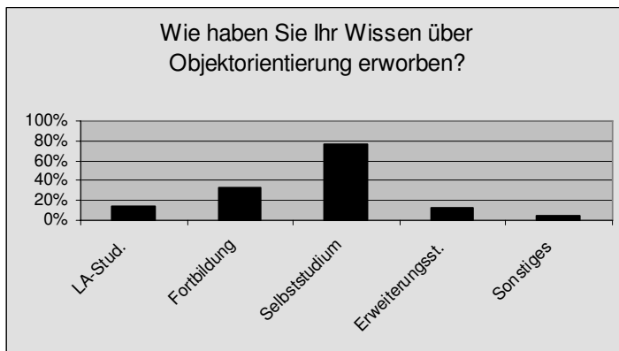
Abbildung 1: Wissenserwerb. Gesamtbetrachtung Berlin/Brandenburg/Thüringen. (n=69)

Zusätzlich müssen mindestens zwei Veranstaltungen in der Didaktik der Informatik belegt werden. Mit der Objektorientierten Sichtweise kommen Lehramtsstudenten im Studium allerdings nur selten in Berührung: Verpflichtend nur kurz in der einführenden Veranstaltung „Rechner- und Netzbetrieb“. Wahlweise können die Veranstaltung „Grundlagen der Softwareentwicklung“ sowie weitere Veranstaltungen aus diesem Bereich belegt werden. Aufgrund einer hohen Arbeitsbelastung geschieht das allerdings nur selten.