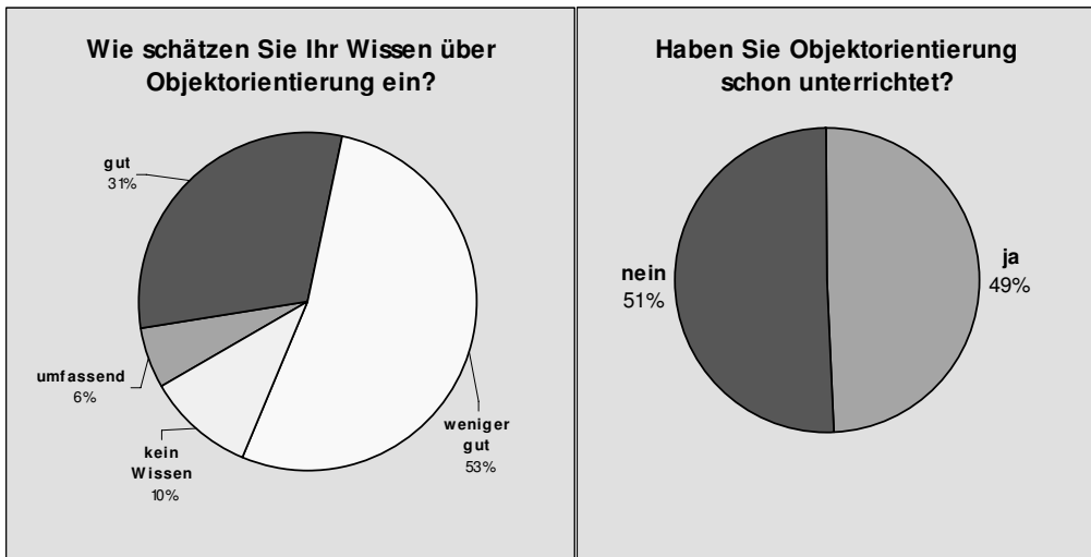
Abbildung 2: Selbsteinschätzung und Unterrichtserfahrungen. Gesamtbetrachtung Berlin/Brandenburg/Thüringen. (n=69)