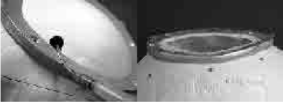
Abb. 1: Resektionsschablone in situ: Die Schablone gibt durch Führung der Säge (links) die Größe des Defekts und die Neigung der Schnittflächen (rechts) vor.