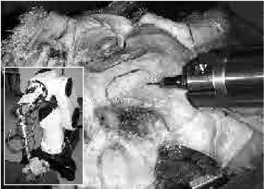
Abb. 4: Versuchsanordnung des Roboters (kleines Bild) während der Knochenresektion (großes Bild)

RX90CR, Orto Maquet, Rastatt, Deutschland) in dem Institut für Prozessrechentchnik und Robotik der Universität Karlsruhe (Abb. 4).