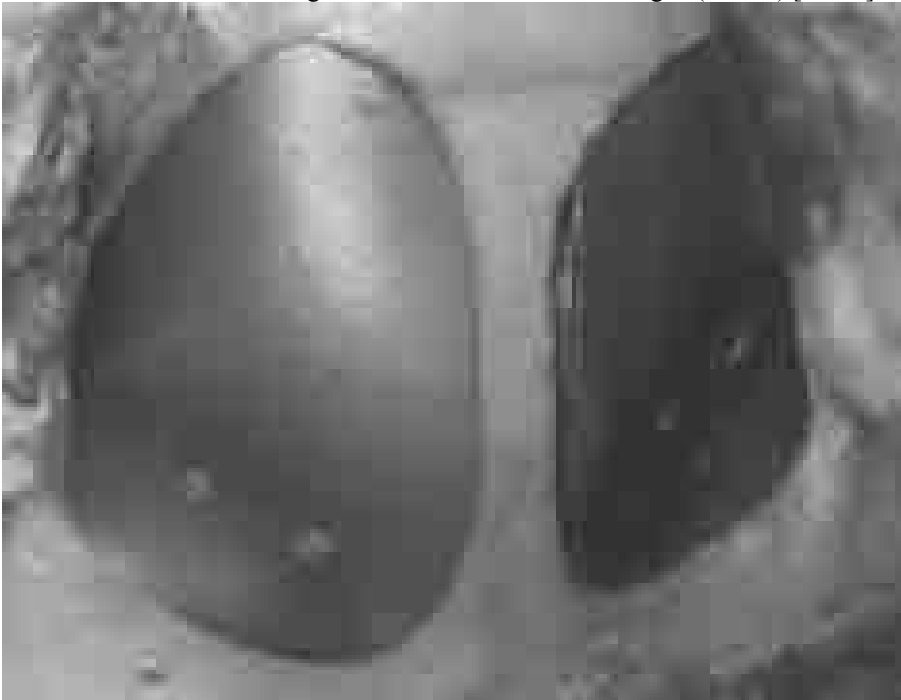
Abb. 5: Mittels Schablone und oszillierender Säge geschaffener Defekt (links) im Vergleich zu der Roboterresektion (rechts) nach Versorgung durch je ein Titanimplantat

Bezüglich der Präzision und Paßgenauigkeit des Implantats war die Resektion mittels Schablone durch einen Chirurgen der Roboterresektion überlegen (Abb. 5) [We00].